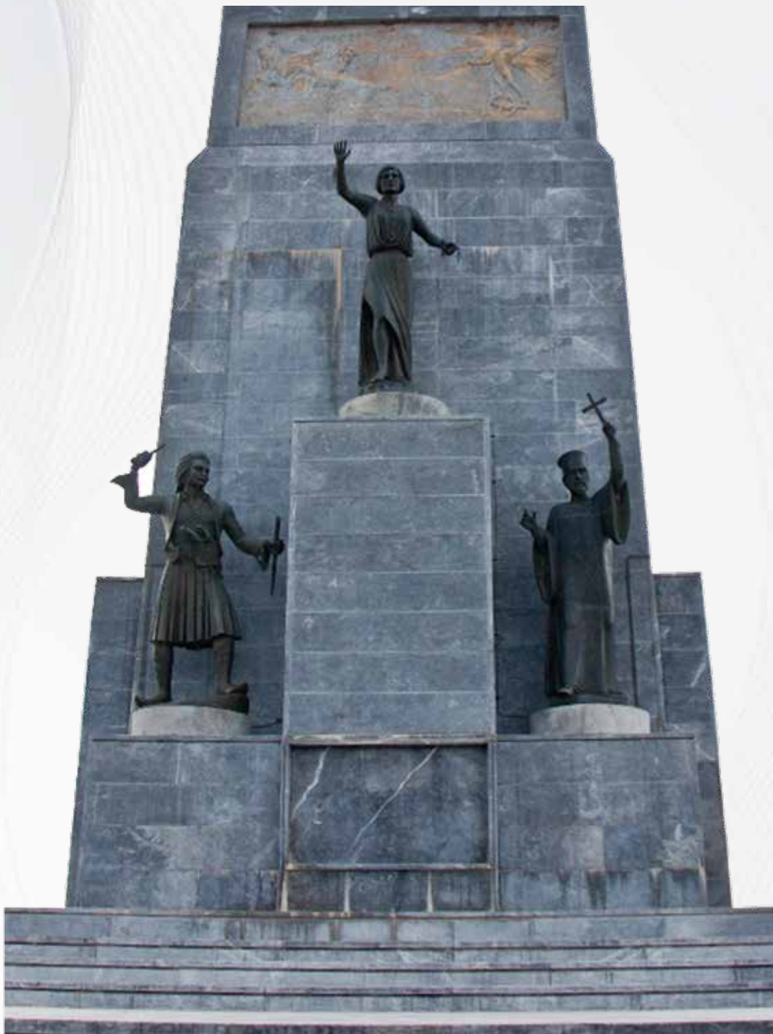
Πανελλήνιο Ηρώων Εθνικής Παλιγγενεσίας