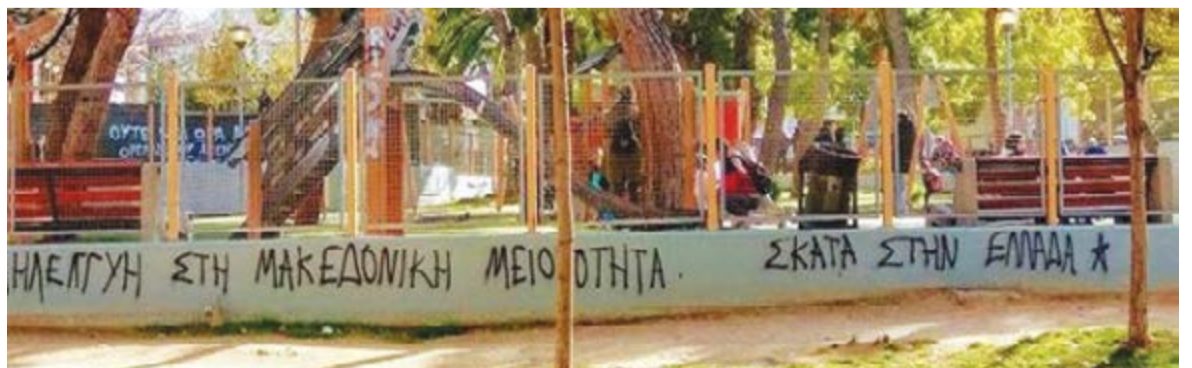
Μαχητική «διεθνιστική αλληλεγγύη», κάπου στα βόρεια προάστια...

Οι νέοι ιδίως άνθρωποι μαθαίνουν έτσι, από όσους διαχειρίζονται τη συμβολική και ακαδημαϊκή εξουσία, ότι είναι, πρώτα από όλα, ή θα πρέπει να αισθάνονται, πολίτες του κόσμου και ότι οι εθνικές τους ταυτότητες δεν έχουν πια και πολλή σημασία στον σύγχρονο διεθνοποιημένο κόσμο. Ότι τα ιστορικά πάθη που συνδέονται με τέτοιες ταυτότητες αργά ή γρήγορα θα ιθασευστούν. Και όλα αυτά συνηθίζονται, καθίστανται ένα διανοητικό λαϊφτοτάιλ. Οι νευρωτικοί πολίτες του κόσμου, με ή χωρίς ψυχοφάρμακα για τα υπαρξιακά τους προβλήματα, εκπαιδευμένοι θεωρητικά και εμπράκτως από τους οργανικούς διανοούμενους, συνηθίζουν στην ιδέα ότι οι ιστορικοί κοινωνικοί και πολιτικοί δεσμοί δεν μπορούν προφανώς παρά να είναι ρευστοί και διαρκώς μεταβαλλόμενοι στο χρόνο. Το ίδιο ακριβώς συμβαίνει με τις λαϊκές συνειδήσεις και τις «παλαιές» ταυτότητες. (Να διευκρινίσουμε ότι η έννοια της ιστορικής ρευστότητας χρησιμοποιείται στην προκειμένη περίπτωση καταχρηστικά, μοιάζοντας με κλειδί πασπαριού για κάθε μετανεωτερική χρήση.) Ένας καλός τρόπος για να επισπευθεί αυτή η πολιτική μετεκπαίδευση του «ξεροκέφαλου» ελληνικού λαού, που εκδηλώνει ακόμα έντονες πατριωτικές ευαισθησίες, θα ήταν λοιπόν ακριβώς η αυταρχική, αντιδημοκρατική, ψυχρή διάψευση των ενστάσεων, από ένα αποφασισμένο ολοκληρωτικό καθεστώς, που θα