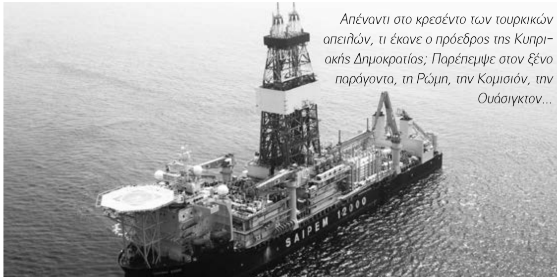
Απέναντι στο κρεσέντο των τουρκικών απειλών, τι έκανε ο πρόεδρος της Κυπριακής Δημοκρατίας; Παρέπεμψε στον ξένο παράγοντα, τη Ρώμη, την Κομισιόν, την Ουάσιγκτον...

Και εκεί κάπου, την Παρασκευή 9 Φεβρουαρίου, έσκασε η είδηση ότι πλοία του πολεμικού ναυτικού της Τουρκίας εμποδίζουν το γεωτρύπανο «Saipem 12000» της ιταλικής εταιρείας ENI να μεταβεί προς τον στόχο «Σουπά», στο τεμάχιο 3, εντός των κυπριακών χωρικών υδάτων. Στην αρχή, το πράγμα κρατήθηκε χαμηλά, σαν να το ξορκίζαν, και όλοι έκαναν λόγο για το νέο υπουργικό συμβούλιο και τα τρανταχτά του ονόματα. Δεν είναι