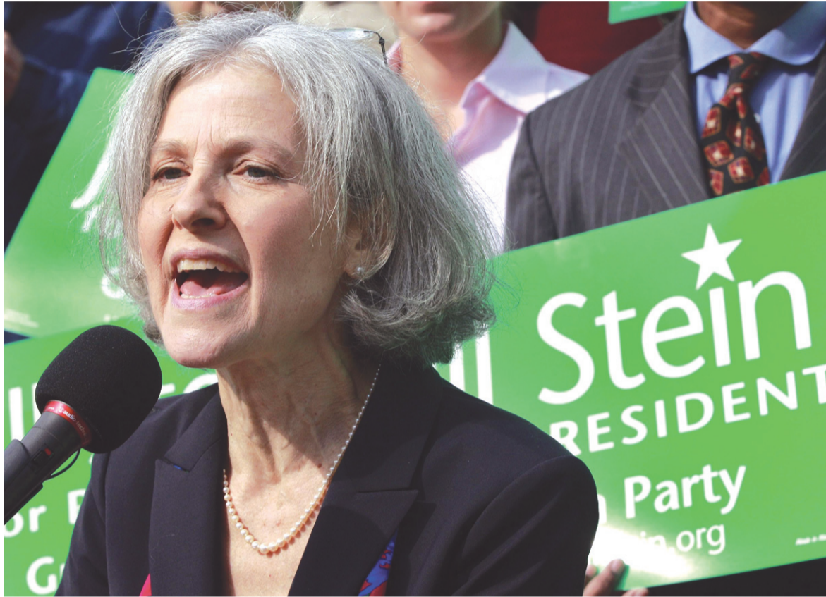
Οι εκλογές του Νοεμβρίου δεν είναι μια μάχη μεταξύ Ρεπουμπλικάνων και Δημοκρατικών, αλλά μια μάχη μεταξύ των εταιρειών και όλων των υπολοίπων

Οι εκλογές του Νοεμβρίου είναι μια μάχη μεταξύ Ρεπουμπλικάνων και Δημοκρατικών. Δεν είναι μια μάχη μεταξύ του Μπαράκ Ομπάμα και του Μιτ Ρόμνι. Είναι μια μάχη μεταξύ του κράτους των εταιρειών και όλων των υπολοίπων, και αυτοί που εξαγείρονται είναι η μόνη μας ελπίδα. Και γι' αυτόν το λόγο θα ψηφίσω τον επόμενο μήνα την Τζιλ Στάιν, υποψήφιο του Πράσινου Κόμματος, αν και το ίδιο εύκολα θα ψήφιζα τον Ρόκι Άντερσον, του Κόμματος Δικαιοσύνης. [...] Αυτοί που θα στηρίξουν το «λιγότερο κακό» ή που δεν θα ψηφίσουν καθόλου ενισχύουν τη στρατηγική των πολυεθνικών ενάντια στην αναιμική μας δημοκρατία.)