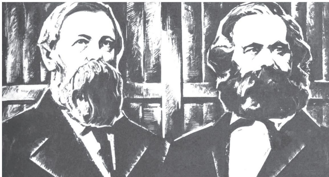
Είναι εντυπωσιακός ο απαξιοτικός τρόπος με τον οποίο αναφέρεται ο Ένγκελς στους λαούς της βαλκανικής

Γεγονότα όπως η απελευθέρωση των βαλκανικών εθνών από τον οθωμανισμό, αφενός θα δημιουργούσαν κράτη, που θα ήταν εξαρτημένα