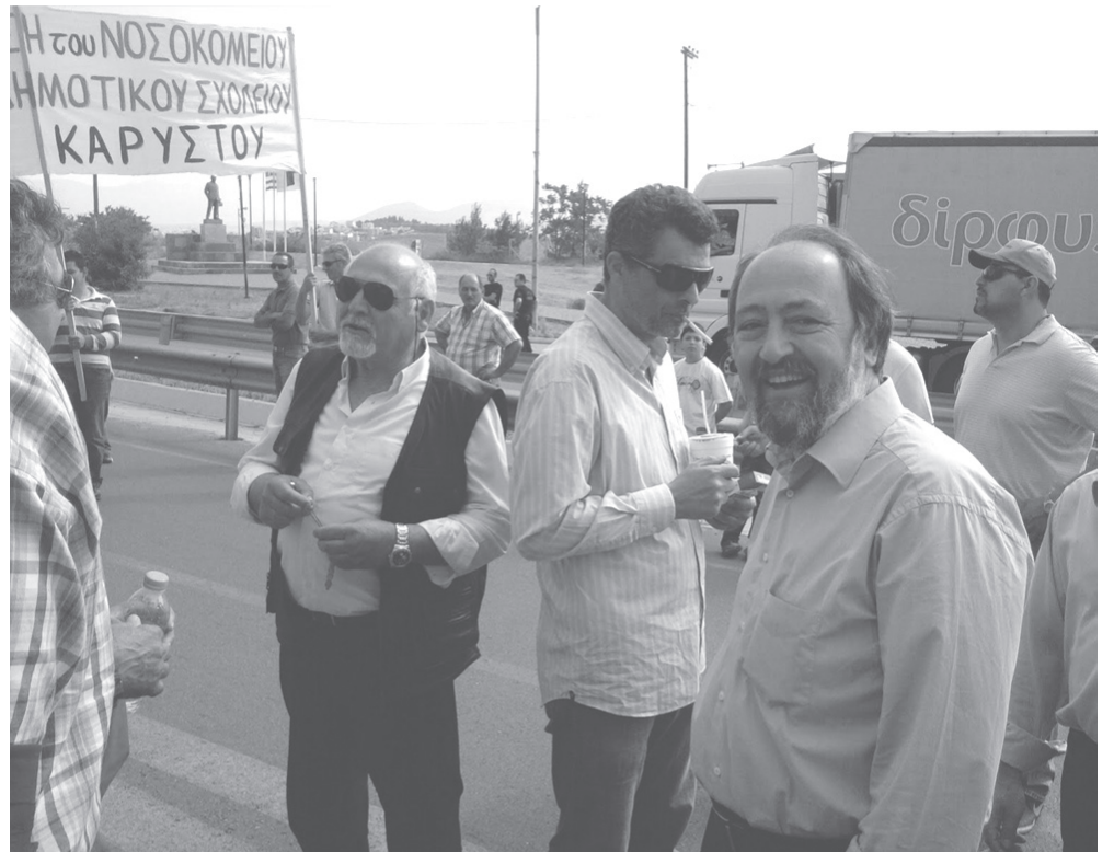
Γ. Μαρίνος: «Το ΚΚΕ δεν μπορεί να κάνει πολιτική, προγραμματική ή εκλογική συνεργασία, με κόμματα που προγραμματικά δεν έχει καμία σχέση όπως ο ΣΥΡΙΖΑ και η «Δημοκρατική Αριστερά».[...] Πρόκειται για κόμματα που εκθρεβούνται τον επιστημονικό σοσιαλισμό, που συκοφαντούν το σοσιαλισμό που οικοδομήθηκε στη Σοβιετική Ένωση και τις άλλες σοσιαλιστικές χώρες.» Φρεσκαδούρες...

Έτσι, σε μια στιγμή που η συντριπτική πλειοψηφία των Ελλήνων, πάνω από το 85%, αναγνωρίζει ότι διάγουμε συνθήκες μιας μεταμοντέρνας κατοχής, το ΚΚΕ ισχυρίζεται το αντίθετο και αλ-