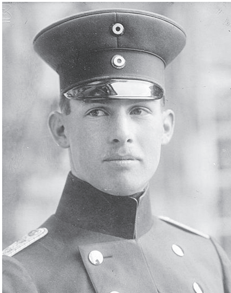
Ο Γεώργιος με στολή της γερμανικής αυτοκρατορικής φρουράς του Α' Π.Π.

Την 3η Νοεμβρίου 1935 λαμβάνει χώρα στην Ελλάδα το, βρετανικής έμπνευσης και κονδύλειας εφαρμογής, δημοψήφισμα για την παλινόρθωση της μοναρχίας και την επιστροφή του Γεωργίου του Β' στη χώρα. Το επίσημο αποτέλεσμα από το δημοψήφισμα-παρωδία είναι 98% υπέρ της μοναρχίας, αφού αφαιρέθηκαν χιλιάδες ψήφοι για να κατέλθει του αρχικού 105%. Ο υπερβάλλον ζήλος των εκλογικών υπευθύνων σε κάποια εκλογικά τμήματα είχε ανεβάσει το ποσοστό υπέρ του βασιλέα στο εξωφρενικό 130%, κάνοντας τον Δανό πρόεδρο να δηλώσει ότι «το όλο θέμα του δημοψηφίσματος του 1935 ήταν μια απίστευτη κωμωδία». Το περιοδικό Τάιμ της εποχής είχε εκτενή ανταπόκριση από την Αθήνα, με λεπτομερείς περιγραφές της αχρειότητας του καθεστώτος Κονδύλη και της «ελευθέρως» εκλογικής διαδικασίας: «Καθώς η ψηφοφορία ήταν φανερό και η συμμετοχή υποχρεωτική, ο ψηφοφόρος είχε να διαλέξει ανάμεσα στο μπλε ψηφοδέλτιο, υπέρ της επιστροφής του βασιλέα και της ασφαλούς εξόδου από το εκλογικό τμήμα, και του κόκκινου, υπέρ της δημοκρατίας και του αγρίου ξυλοφορτώματος από τους παρακρατικούς, που παραδοκούσαν στον αυλόγυρο για τα περαιτέρω». Με αυτόν τον τρόπο μεθοδεύτηκε η επιστροφή του εμπιστού Γεωργίου από τους Βρετανούς, οι οποίοι προλαμβάνουν, έτσι, την όποια μετακίνηση της Ελλάδας στο γερμανικό στρατό-