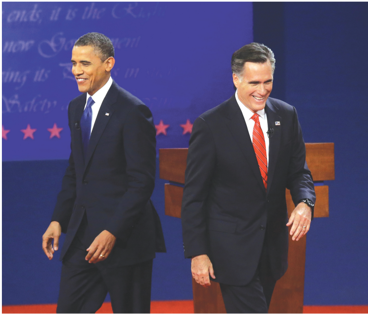
Τα πιο σημαντικά γνωρίσματα της κοινής γνώμης των ΗΠΑ σε σχέση με την αμερικανική εξωτερική πολιτική, είναι η αβεβαιότητα και η έλλειψη διαύγειας.

Τα πιο σημαντικά γνωρίσματα της κοινής γνώμης των ΗΠΑ, σε σχέση με την αμερικανική εξωτερική πολιτική, είναι η αβεβαιότητα και η έλλειψη διαύγειας. Πρόσφατες δημοσκοπήσεις καταδεικνύουν ότι για πρώτη φορά η πλειοψηφία των Αμερικανών πιστεύει πως οι στρατιωτικές επεμβάσεις του Μπους στη Μέση Ανατολή ήταν ένα τραγικό λάθος. Οι άνθρωποι βλέπουν ότι η σημερινή ιρακινή κυβέρνηση είναι πιο κοντά στην ιρακινή -πολιτικά, αλλά και από άποψη εθνικού συναισθήματος- παρά στην αμερικανική. Βλέπουν ότι η αφγανική κυβέρνηση κρατείται στην εξουσία με το ζόρι, με ένα στρατεύμα του οποίου πολλά μέλη πρόσκεινται φιλικά προς τους ταλιμπάν και μπορούν ανά πάσα στιγμή να στρέψουν τα όπλα τους κατά των Αμερικανών. Η κοινή γνώμη στις ΗΠΑ θέλει τα στρατεύ-