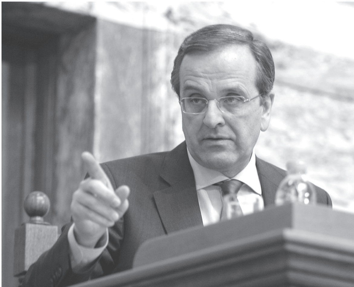
Εν τέλει, αυτό που κρατάει όρθιο τον Σαμαρά είναι η...καταιγιστική επίθεση των Γερμανών, που επιβάλλουν διαρκώς μέτρα αντί μέτρων, με συνέπεια να βρισκόμαστε σε μια κατάσταση διαρκούς έκτακτης ανάγκης

κούνται στο να κάνουν τα κυβερνητικά φερέφωνα στις κεντρικές συνεδριάσεις της Βουλής, όπου αυτό είναι αναπόφευκτο, ενώ οι περισσότεροι μετρούν τις τελευταίες μέρες του κοινοβουλευτικού τους βίου, καθώς και οι ίδιοι είναι σίγουροι πως, με αυτά που λένε και κάνουν, έχουν χάσει και τους τελευταίους από τα κάποια ισχυρά πελατειακά τους δίκτυα. Φοβούνται, μάλιστα, ότι δεν θα μπορούν καν να κυκλοφορήσουν, καθώς είναι γνωστή η σχέση αγάπη-μίσους που διατηρεί η ελληνική πελατεία με τον πολιτικό πάτρωνα, και είναι πολύ εύκολο, αυτοί που σήμερα σε αποθεώνουν, αύριο να σε περιμένουν έξω από το σπίτι σου για να σε δείρουν.