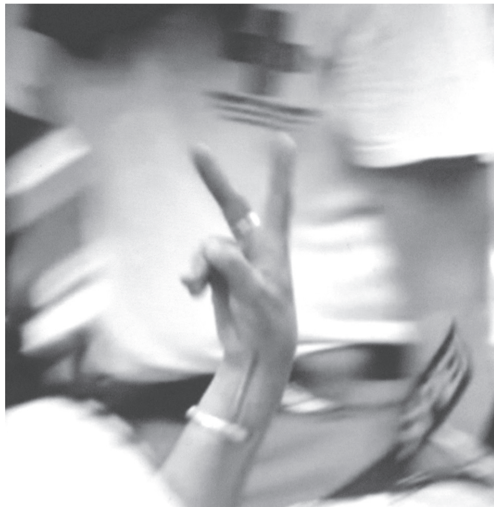
Δεν φοβόμαστε για μια κατοχή που θα έρθει. Είναι ήδη εδώ

Μια χύτρα ταχύτητας είναι η ελληνική κοινωνία, που βράζει τρελά. Κι η βαλβίδα