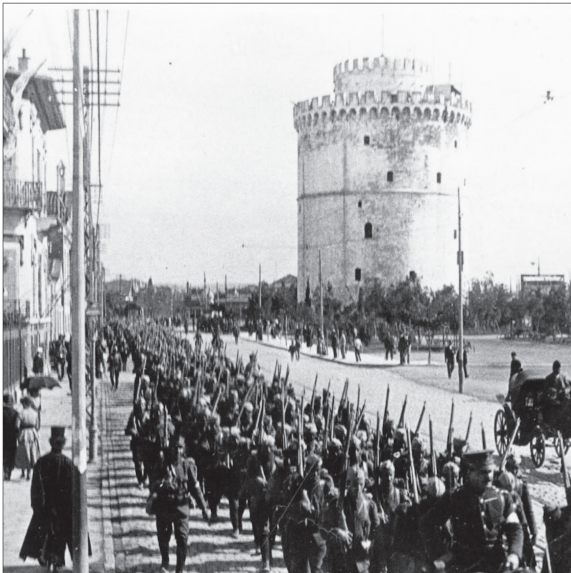
Ο πολιτικός ο οποίος κράτησε στα χέρια του το πηδάλιο της Ελλάδας μετά το 1910, ήταν ένθερμος υπέρμαχος της «Μεγάλης Ιδέας» στην εδαφική εκδοχή της

Μετά την πρώτη δεκαετία του 20ού αιώνα, παρά την ευνοϊκή διεύθυνση του Κρητικού Ζητήματος, η Ελλάδα βρισκόταν σε δυσμενή θέση τόσο από άποψη εσωτερικής κατάστασης, όσο και από άποψη κύρους σε διεθνές επίπεδο. Εκτός από την ταπεινωτική ήττα από την Οθωμανική Αυτοκρατορία στον πόλεμο του 1897, η πολιτική, οικονομική και κοινωνική κατάσταση της Ελλάδας κατά την πρώτη δεκαετία του 20ού αιώνα ήταν ιδιαίτερα άσχημη. Η χώρα αντιμετώπιζε συσσωρευμένα προβλήματα με αβέβαιη έκβαση και υπήρχε μια διάχυτη αίσθηση ηθικής και πολιτικής τελεμνωσης. Η Ελλάδα παρέμενε χώρα με αγροτικό χαρακτήρα. Το άλτο από την εποχή του 1821 αγροτικό πρόβλημα(1), που το έκανε ακόμα οξύτερο η ύπαρξη των τσιφλικιών με τις αυξανόμενες μάζες των ακτημόνων καλλιεργητών, επέτεινε η προσάρτηση της Θεσσαλίας στην Ελλάδα (1881). Η αγροτική τάξη μόλις είχε αρχίσει να αποκτά συνείδηση των δικαιωμάτων της, με αγώνες που ξεκίνησαν από τα τσιφλίκια της Θεσσαλίας(2).