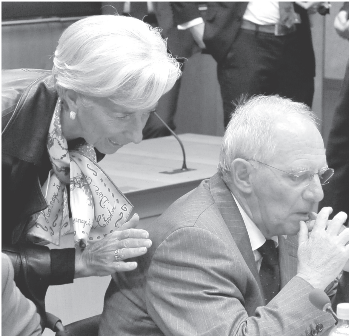
Όπως άλλωστε γράφει ο ξένος Τύπος, η τρόικα απαιτεί οι Έλληνες να εργάζονται 6 μέρες την εβδομάδα και 13 ώρες την ημέρα

«Η φετινή ετήσια έκθεση του Διεθνούς Νομισματικού Ταμείου (ΔΝΤ) περιελάμβανε δύο εκπλήξεις εξαιρετικής σημασίας, παραχωμένες ανάμεσα στις λεπτομέρειες της οικονομικής ανάλυσης και των προβλέψεων. Στην πρώτη, ο διεθνής οργανισμός επικαλείται την νεότερη εμπειρική επιστημονική έρευνα για να ισχυριστεί ότι η λιτότητα δεν δουλεύει. Αποτελεί κομβική στροφή στην παραδοσιακή πολιτική του οργανισμού και προκάλεσε δημόσια σύγκρουση μεταξύ της επικεφαλής του ΔΝΤ Κριστίν Λαγκάρντ και του Γερμανού υπουργού Οικονομικών Βόλφγκανγκ Σόιμπλε. Στη δεύτερη, παραδέχεται ότι ούτε η «εσωτερική υποτίμηση» δουλεύει. Αυτό έχει τεράστια σημασία για την Ελλάδα, καθώς αποτελεί ουσιαστικά παραδοχή ότι η θεραπεία που εφαρμόζεται με στόχο την παραμονή στο ευρώ έχει αποτύχει». (Κώστας Παπαδημητρίου, Capital.gr, 17.10.2012).