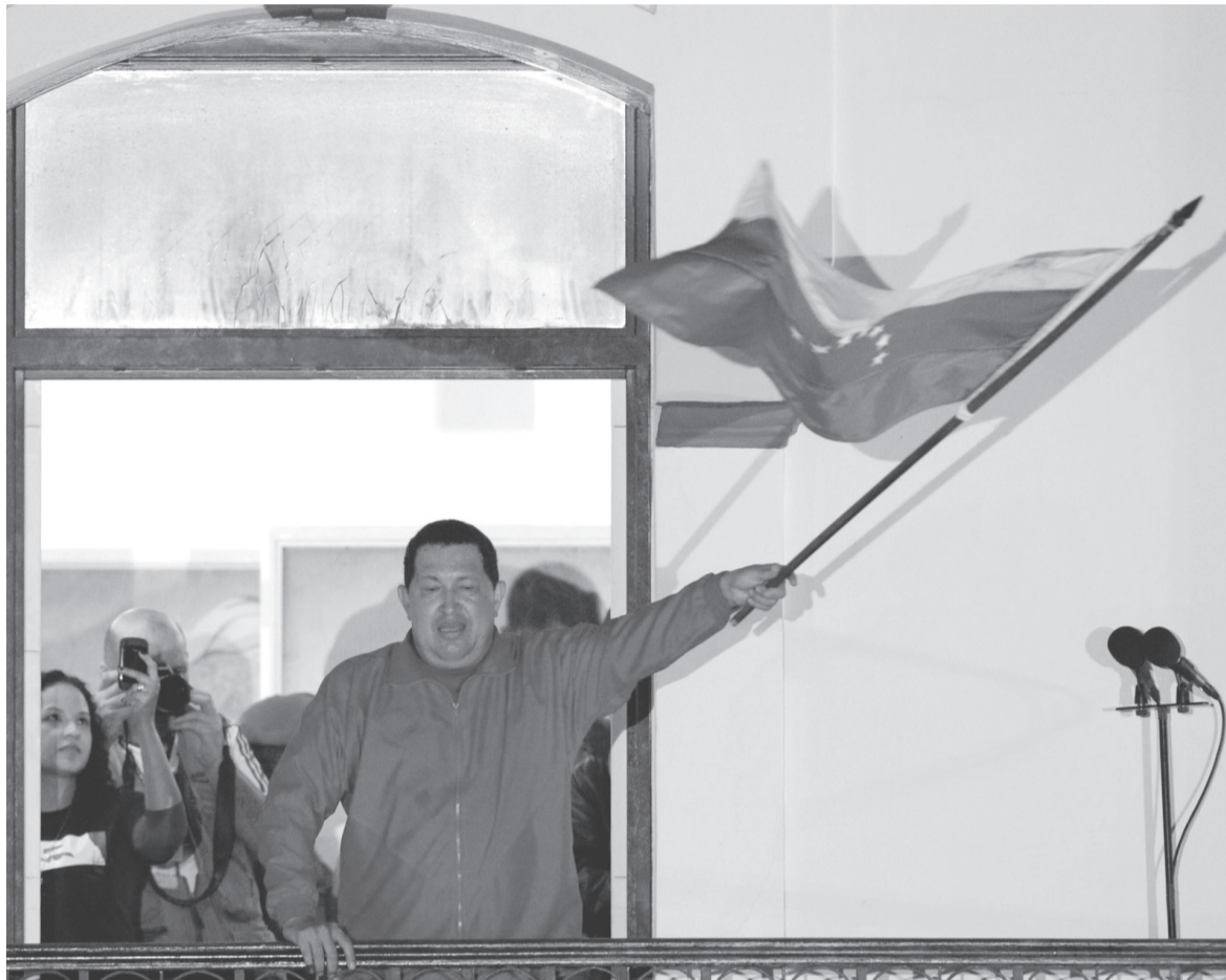
Η διάχυση της κακοδιοίκησης έχει τεράστιες πολιτικές συνέπειες: Ευθύνεται μάλλον για πάνω από τις μισές ψήφους που μετακινήθηκαν προς την αντιπολίτευση...

Οι «μετριοπαθείς» υποστηρίζουν ότι οι κρατικές-ιδιωτικές πρωτοβουλίες, που βασίζονται σε μεικτές κοινοπραξίες θα εδραιώσουν και θα διευρύνουν την απήχηση του Τσάβες στις «μεσαίες τάξεις» και θα προετοιμάσουν το έδαφος για ευρύτερες κυβερνητικές συνεργασίες, ιδιαίτερα εάν η αντιπολίτευση κερδίσει κάποιες περιφέρειες και απειλήσει την κυβερνητική πλειοψηφία στο Κογκρέσο. Οι «μετριοπαθείς» υποστηρίζουν ότι ο «διάλογος» μεταξύ του Τσάβες και της αντιπολίτευσης, που θα στηρίζεται στην ιδέα μιας συμμαχίας με κομμάτια της «παραγωγικής αστικής τάξης», και θα στοχεύει σε συγκεκριμένες επενδύσεις [...], θα καταλαγιάσει την πώληση και θα διευκολύνει τον διάλογο με τις ΗΠΑ, ιδιαίτερα στην περίπτωση που επανεκλεγεί ο Ομπάμα. Οι «μετριοπαθείς» συγκεντρώνονται κυρίως μεταξύ των ανώτερων αξιωματούχων, των κυβερνητικών, των υπουργών, των ηγετών του κόμματος και μεταξύ των συμβούλων του προέδρου, πολλοί από τους οποίους βρίσκουν υποστηρικτές σε ομάδες δημοσίων υπαλλήλων.