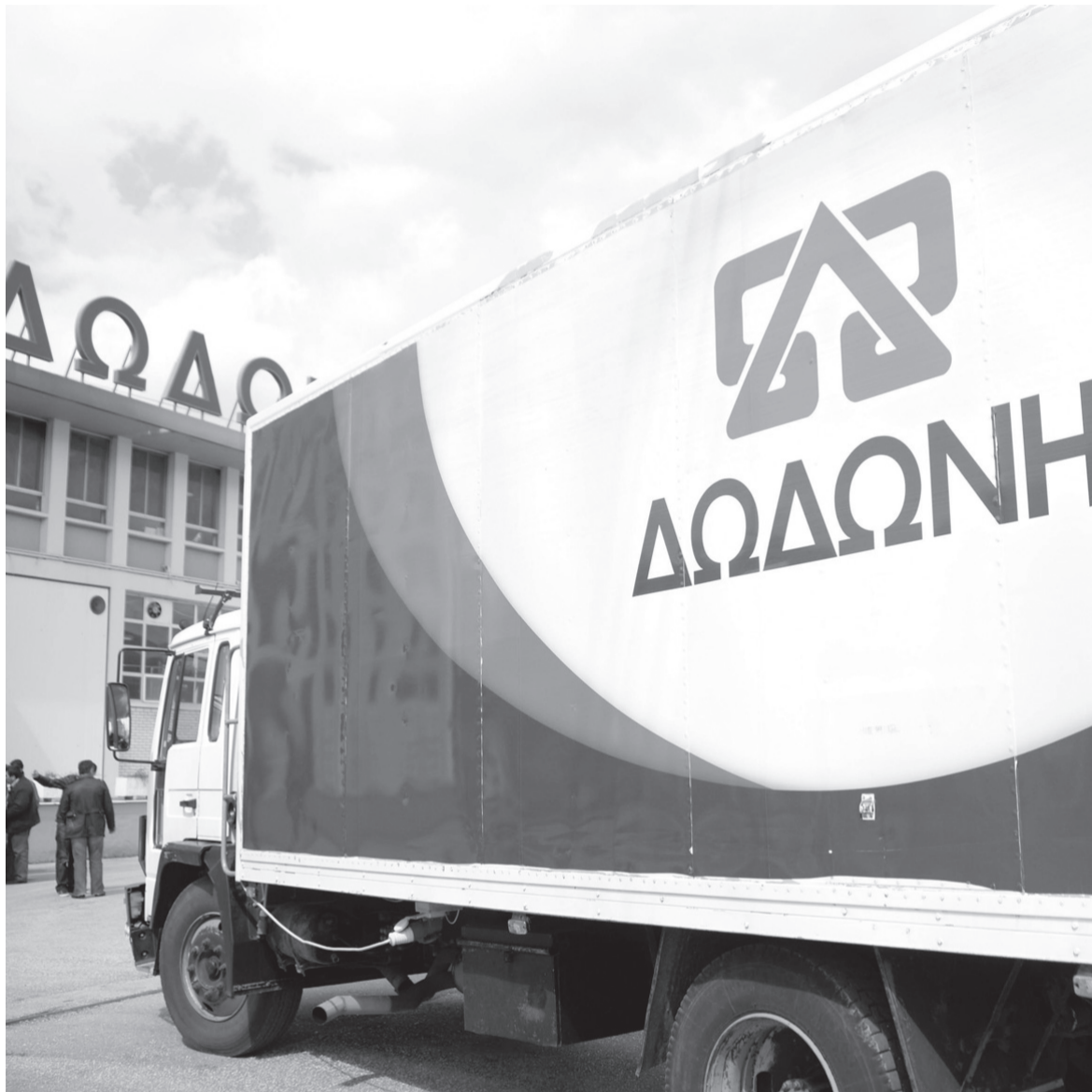
Το μοντέλο της ιδιωτικοποίησης της Δωδώνης είναι αυτό που θα εφαρμοστεί σε όλες τις υπό πώληση κερδοφόρες εταιρείες του ευρύτερου δημόσιου τομέα.

Η αλλαγή του ιδιοκτησιακού καθεστώτος σηματοδοτεί –και όχι τυχαία– την απαρχή των ιδιωτικοποιήσεων που προωθεί η εφαρμογή των πολιτικών της τρόικας και υποστηρίζει αναφάδον το νεοφιλελεύθερο λόμπι της τρικομματικής κυβέρνησης. Το μοντέλο της ιδιωτικοποίησης της Δωδώνης είναι αυτό που θα εφαρμοστεί σε όλες τις υπό πώ-